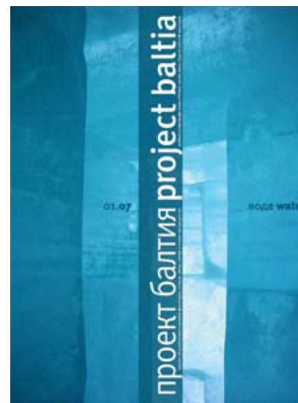
↑ Обложка первого номера журнала «Проект Балтия» «Вода»