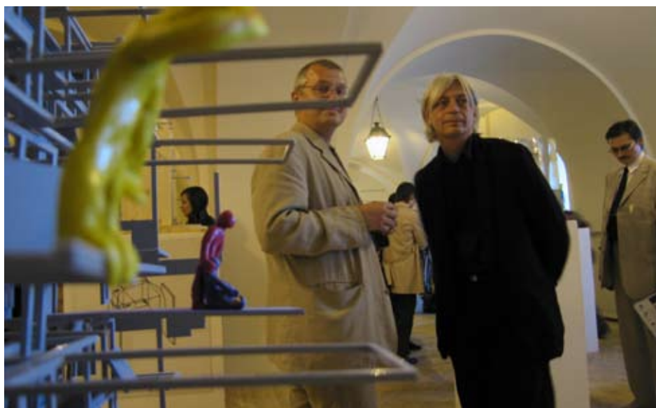
↑ Презентация первого номера журнала «Проект Балтия» «Вода»