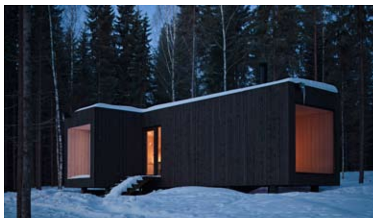
↑ Avanto Architects. Four-cornered Villa, Finland.