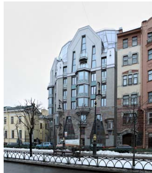
↑ Архитектурная мастерская Мамошина. Жилой дом на пр. Чернышевского.

В день открытия выставки состоятся лекции кураторов и участников проекта, а также петербургских архитекторов