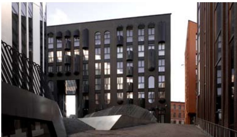
↑ KOSMOSES. Rotermann block. Tallinn.