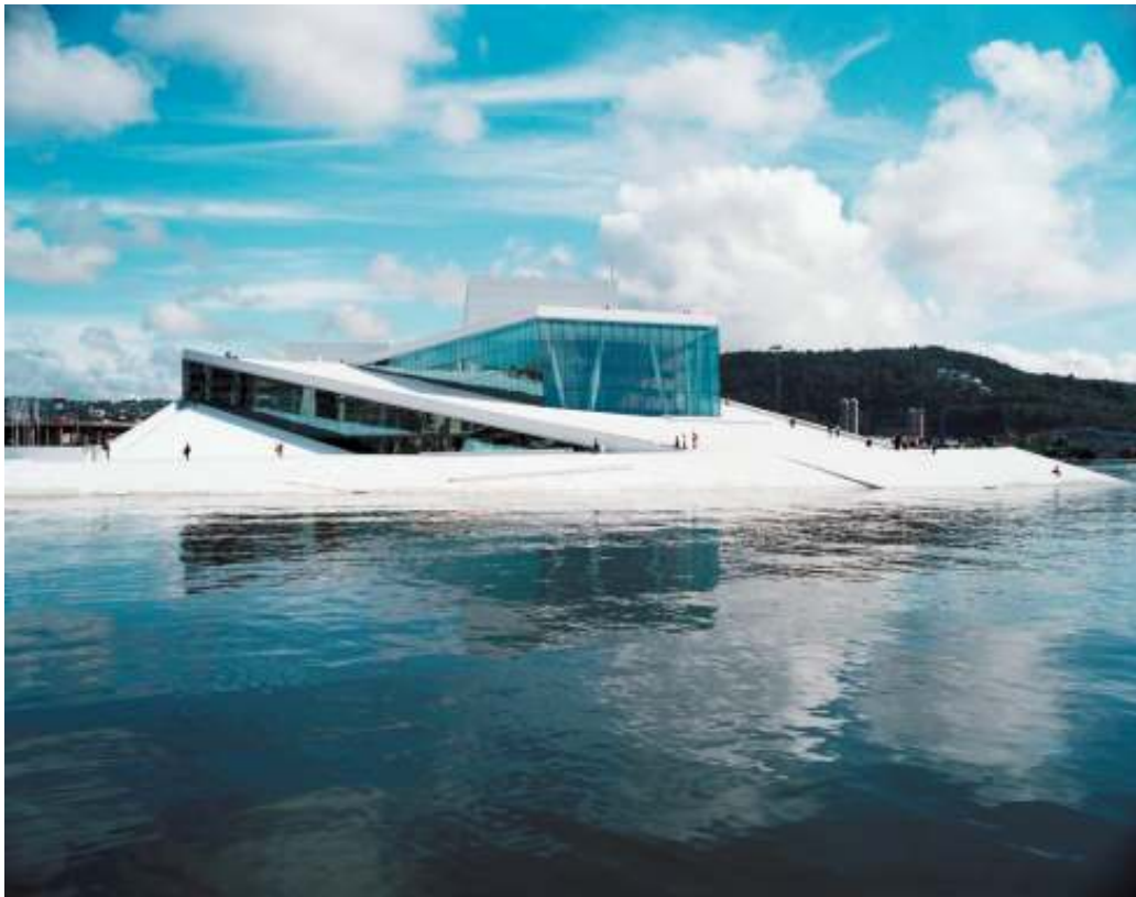
Новый театр оперы и балета в Осло 2008 г., 38.500 кв.м.