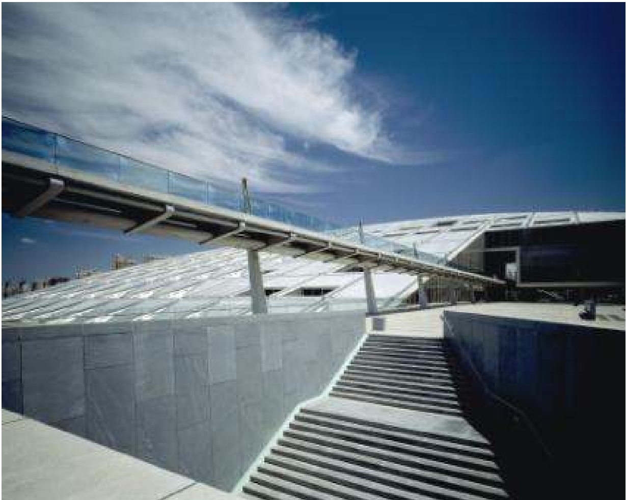
Александрийская библиотека 2001 г., 8000 кв.м.