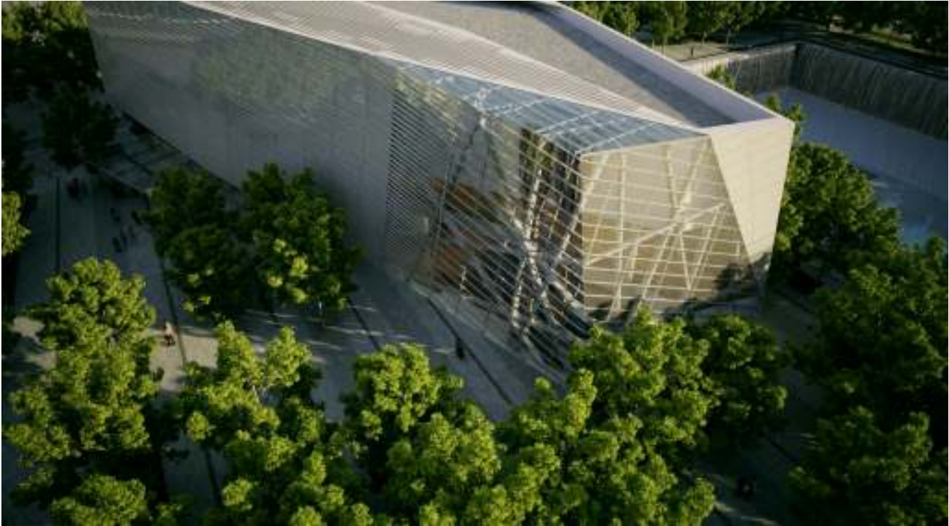
Музей 11 сентября на Нулевом уровне 2011 г.