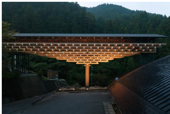
Слева: Фотограф: Kengo Kuma and Associates Справа: Музей — деревянный мост Юсухара. Фотограф: Такуми Ота