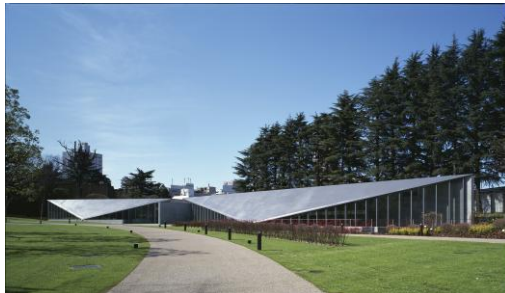
Слева: Фотограф: Tadao Ando Architect & Associate Справа: Культурный комплекс «21_21 Design Sight». Фотограф: Mitsuo Matsuoka