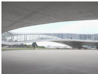
Слева: Фотограф: Takashi Okamoto. Справа: Учебный центр Rolex. Фотограф: SANAA.