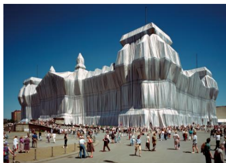
Слева: Христо и Жанна-Клод на "Воротах", Февраль 2005 г. Справа: Упакованный Рейхстаг, Берлин, 1971-95