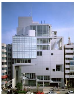
Справа: Spiral. Фотограф: Toshiharu Kitajima