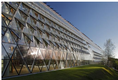
Слева:  Справа: