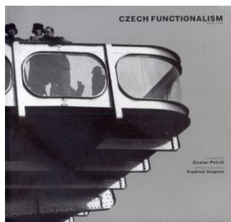
Справа: " Czech Functionalism 1918 /1938 " (АА Лондон).