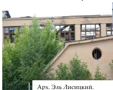
Арх. Эль Лисицкий. Типография, 1930-32. 1-й Самотечный пер., д. 17А

Сохранение и реставрация архитектурного наследия XX века, в том числе архитектурного авангарда 1920-1930-х годов, насчитывает несколько десятилетий. Созданы соответствующие доктрины и институции, накоплен теоретический и практический опыт, которые подтвердили чрезвычайную сложность и противоречивость этого процесса. Угрозы разрушения и всевозможные аномалии обнаруживаются даже в странах, обладающих развитой системой законодательства и защиты культурного наследия. По сравнению с многовековой историей классической реставрации, «новое наследие», переживающее свое инобытие в ранге «памятника», находится у истоков формирования собственной философии и методологии консервации. Россия в этой области сильно отстала и демонстрирует примеры деградации памятников и сомнительных «реставрационных» подходов к лучшим из созданных